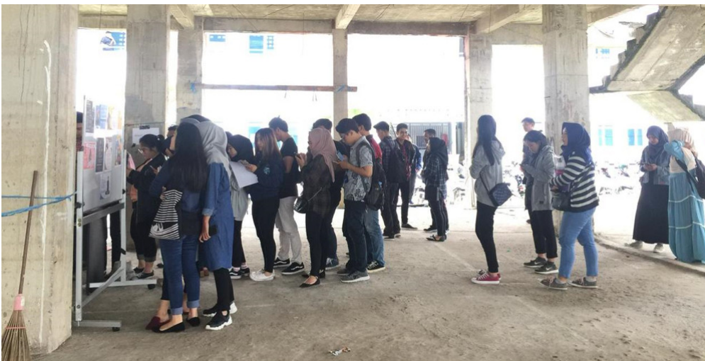
Foto 3: Antusias mahasiswa mengikuti Pemira DPM FH UNMUL 2019 dapat terlihat dari antrian di TPS.